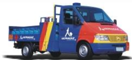
Exemplos de veículos atuais da frota Ultragas, para entrega no sistema Ultrasystem (granel, à esquerda) e envasado (direita)