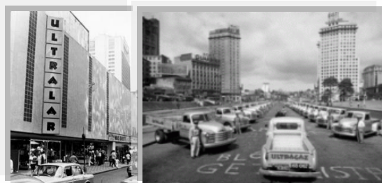
Na década de 1950, a rede de loja Ultralral (esquerda) e uma parte da frota da Entrega Automática (direita)

Também é dos anos 50 a criação do inovador sistema de distribuição de gás, que foi adotado por todas as empresas do setor: a "Entrega Automática". Naquele momento, a Ultragas se consagrou com o slogan "Semana sim, semana não, Ultragas no seu portão".