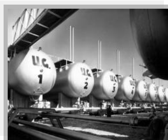
Botijões antigos (esquerda) e tanques de uma das primeiras bases de envasamento

Em 26 de setembro de 1938, o capital da empresa foi aberto e surgiu a Ultragaz S/A, que logo deixaria de ser uma empresa regional para atuar em todo o país. A grande expansão se deu depois do final da Segunda Guerra Mundial.